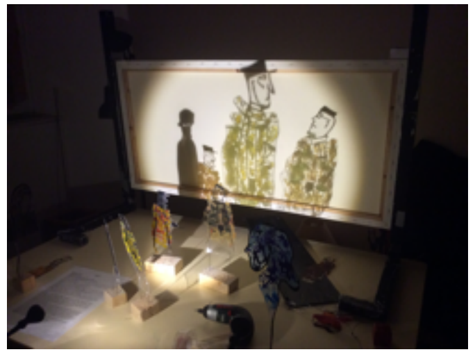
Projection des ombres (Aquarium)