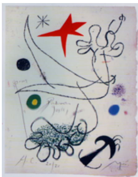
Illustration du poème Mavéna de Radovan Ivšić par Juan Miró

Avec les années 1970, l'œuvre de Radovan Ivšić est peu à peu « réhabilitée » en Yougoslavie sous la pression des jeunes générations qui choisissent même le nom d'une de ses pièces, Gordogane , pour titre de leur revue. Un peu avant la publication de son théâtre, paraît, en 1974, Crno , un important choix de ses anciens poèmes.