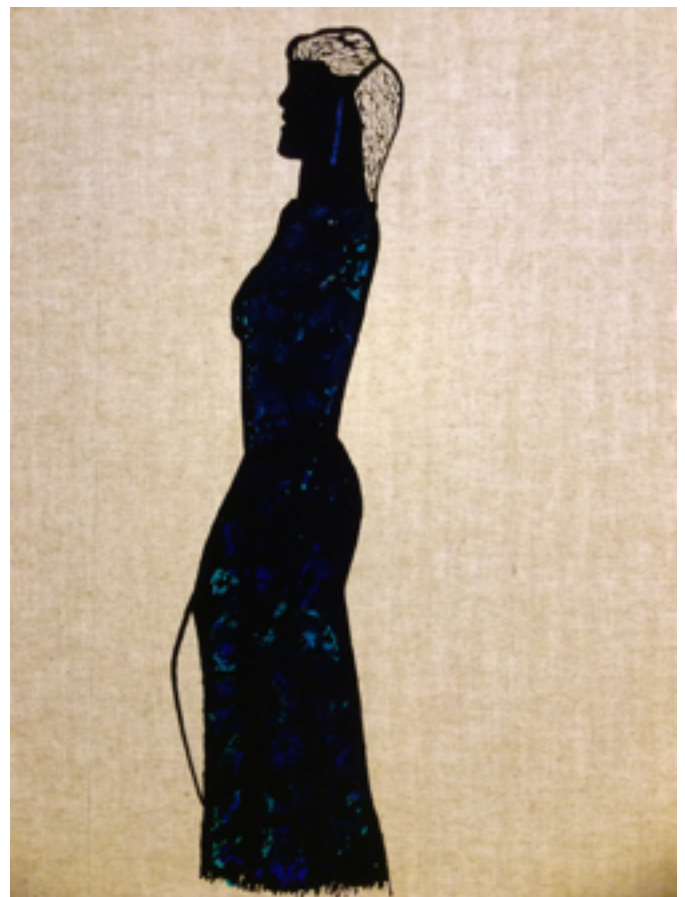
Esquisse pour le personnage Plume (Aquarium)