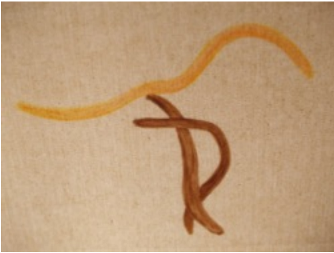
Oiseau de feu (Vané)